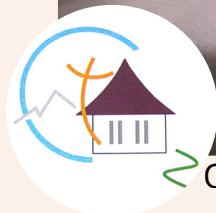
Oratoire de Mambré